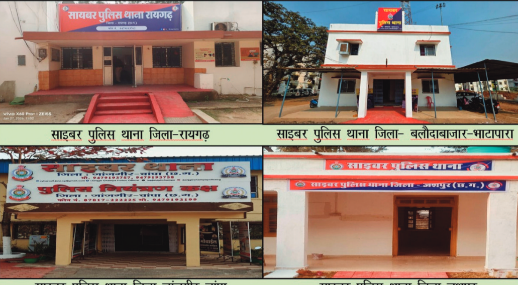
साइबर पुलिस थाना जिला-रायगढ़ साइबर पुलिस थाना जिला-बलौदाबाजार-भाटापारा साइबर पुलिस थाना जिला-जंजगीर-चांपा साइबर पुलिस थाना जिला-जशपुर

मुख्यमंत्री साय ने इस मौके पर कहा कि आज का दिन पुलिस विभाग के लिए अत्यंत सौभाग्य का है, क्योंकि 255 करोड़ रुपए के विभिन्न निर्माण कार्यों का लोकार्पण किया गया है। उन्होंने कहा कि प्रेजेंटेशन के माध्यम से हमने देखा कि साइबर थाना, एसडीओपी कार्यालय, चौकी भवन, ट्रांजिट हॉस्टल एवं आवासीय भवन अत्यंत सुंदर और सुविधाजनक बनाए गए हैं। मुख्यमंत्री ने गुणवत्तापूर्ण निर्माण के लिए संबंधित एजेंसियों की सराहना करते हुए कहा कि इन सुविधाओं से पुलिस अधिकारियों एवं कर्मचारियों को सकारात्मक वातावरण में कार्य करने की प्रेरणा मिलेगी और वे अपने कर्तव्यों का और अधिक प्रभावी ढंग से निर्वहन कर सकेंगे। साय ने कहा कि सरकार का सतत प्रयास है कि कर्मचारियों और अधिकारियों को बेहतर आवास एवं कार्य सुविधाएं उपलब्ध कराई जाएं, जिससे प्रदेश में कानून व्यवस्था और अधिक सुदृढ़ हो सके। उन्होंने कहा कि यह एक अच्छी शुरुआत है और इससे सुदूर अंचलों तक भी सुरक्षा व्यवस्था को मजबूत किया जा सकेगा। उप मुख्यमंत्री एवं गृह मंत्री विजय शर्मा ने बताया कि प्रदेश में साइबर अपराधों पर प्रभावी नियंत्रण के लिए अनेक स्थानों पर साइबर पुलिस थानों की शुरुआत की जा रही है। आज जशपुर, रायगढ़ और राजनांदगांव जिलों सहित कुल 8 नए साइबर थानों का शुभारंभ किया गया है। इससे