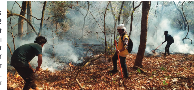
तहसीलदार ने संभाला मोर्चा