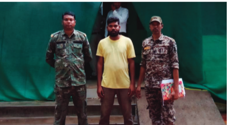
पिलखा भूमि ◀ समुद्र मंडल ▶